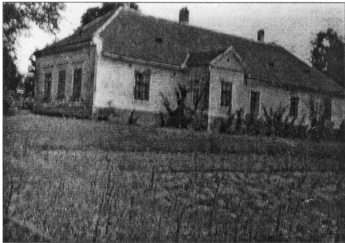
A Perczel ház 19. század második felében

Perczel ház: Feltehetően a Sárközy család építtette a 18. század végén, 1846 után került a Perczel család tulajdonába, a 19. század második felében a Szemerey család birtokolta. Téglalap alaprajzú, földszintes, nyeregtetős épület. Oromfalas utcai homlokzatán két, fekvő ovális padlásablakkal. Utcai és udvari homlokzatai faltükrökkel tagoltak. A háromszögű utcai oromfalon két fekvő ovális kis ablak, közöttük barokkos keretdísz.