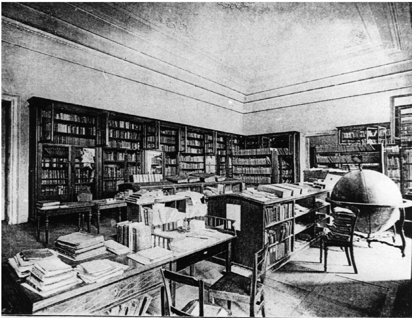
LATIN KÉZIRATOK TERME A MAGYAR NEMZETI MÚZEUM KÖNYVTÁRÁBAN.