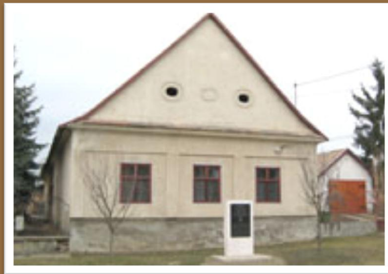
A Perczel ház ma