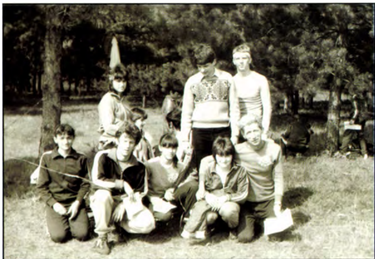
Az SZVSE apraja-nagyja (Szikra, 1982)