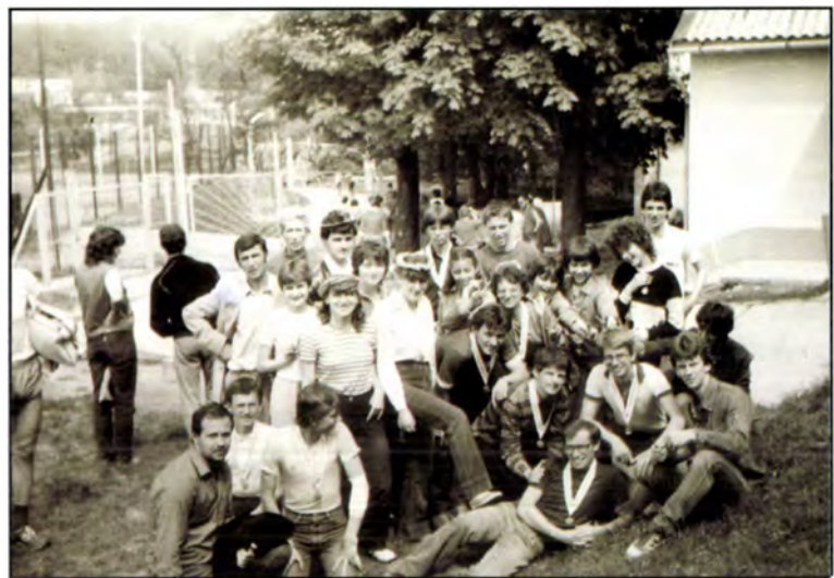
SZVSE csoportkép (Mecsek Kupa, 1983)