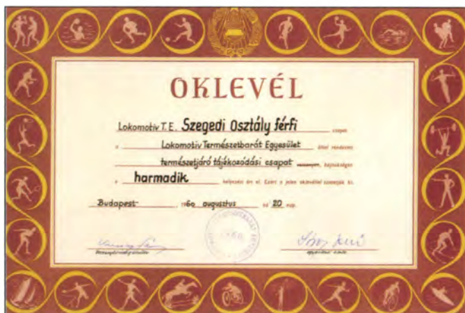
Oklevél a legendás '60-as időkből (CSB, felnőtt férfiak) (SZVSE archívum, 1960)

Összeállította: Sindely Pál – Szokol Lajos – Gera Tibor