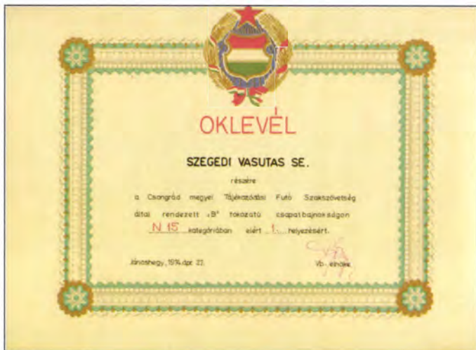
Oklevél a legendás '70-es időkből (CSB, serdülő leány) (SZVSE archívum, 1974)