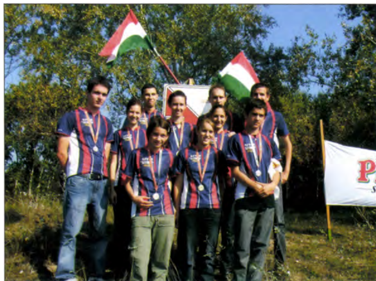
Egyesületei Váltó OB érmesei (nők I. hely, férfiak II hely) (Kakas-hegy, 2007)