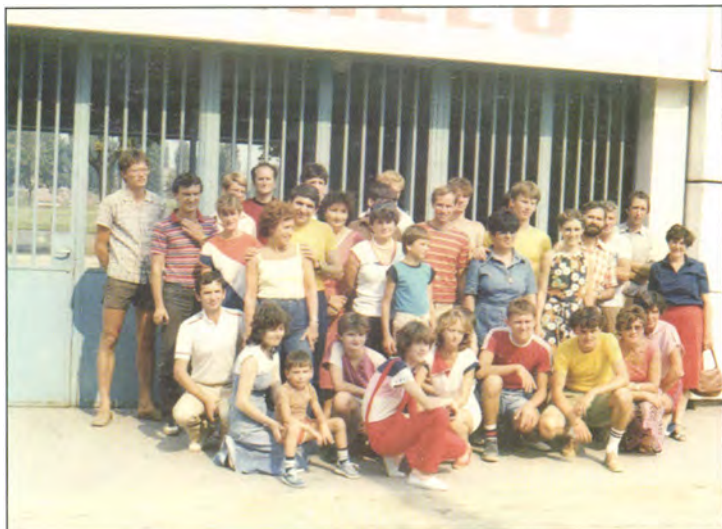
A Svédországba utazó csapat, az indulás előtt 1985-ben