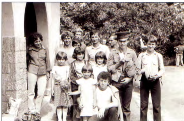
SZVSE csoportkép (Pilisvörösvár, 1979)