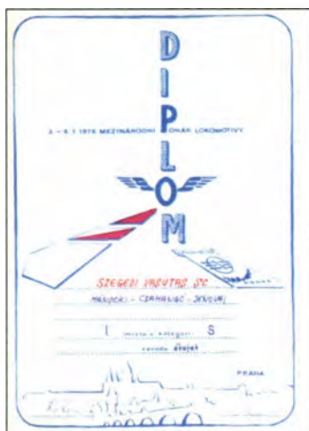
Oklevél Prágából (Nemzetközi Vasutas Kupa, 1976)