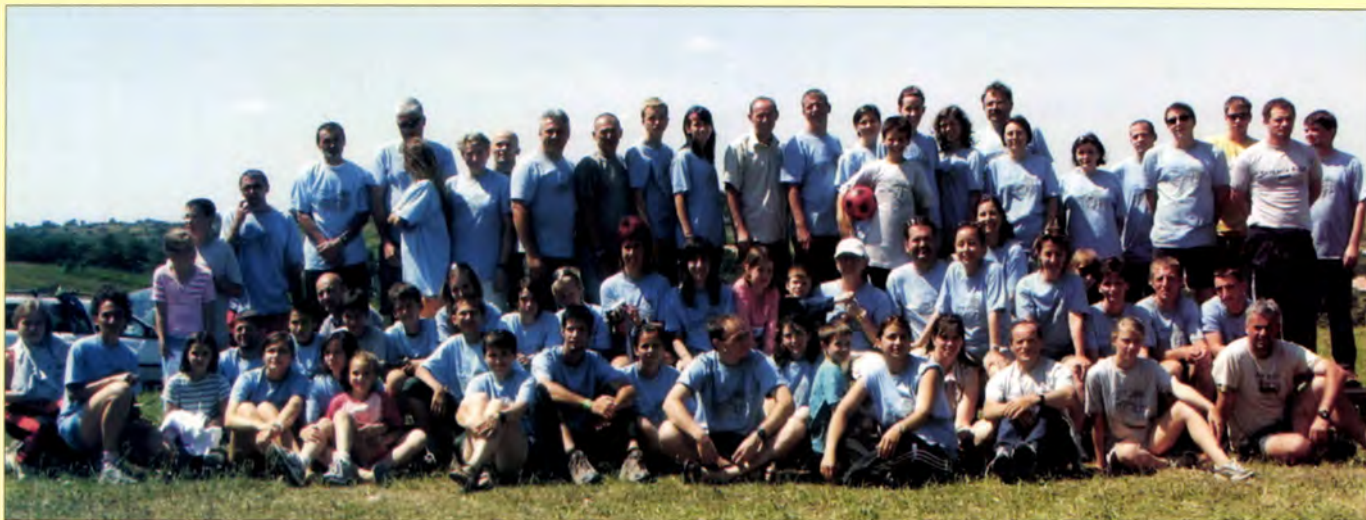
Hungária Kupa rendezői (Tata, 2008)