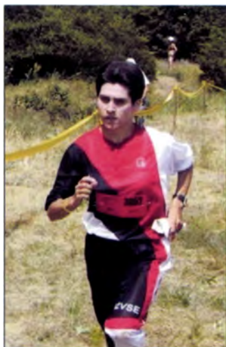
Oláh Katalin kétszeres egyéni világbajnok