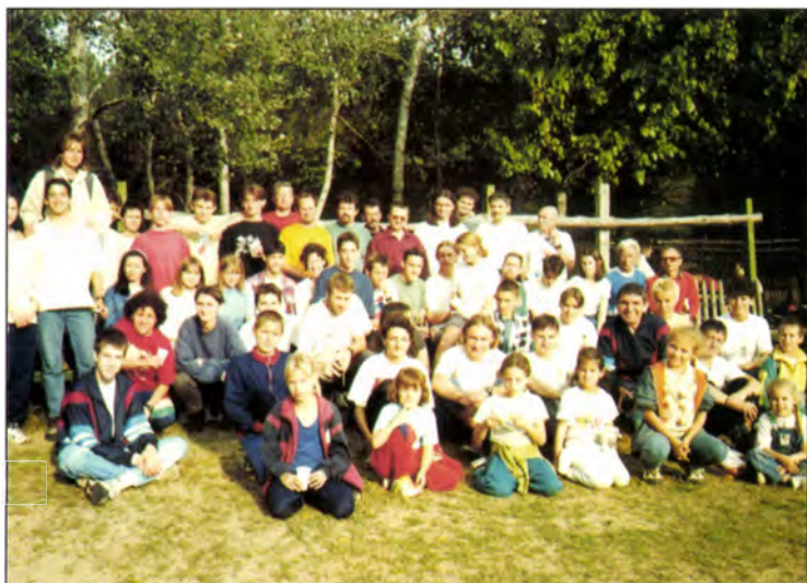
Az SZVSE rendezői 1998-ban (OCSB, Zsana, Pásztor tanya)