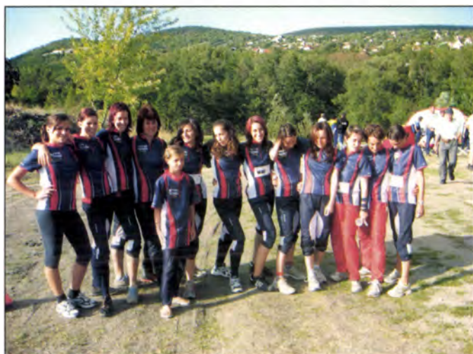
SZVSE „félkörben” áll egy kislányka