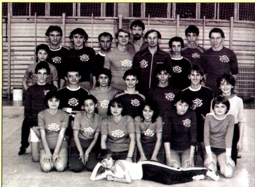
SZVSE versenyzői kerete 1983-ban