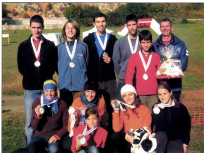
Országos Pontbegyűjtő és Egyesületi VB győztesei (2008)