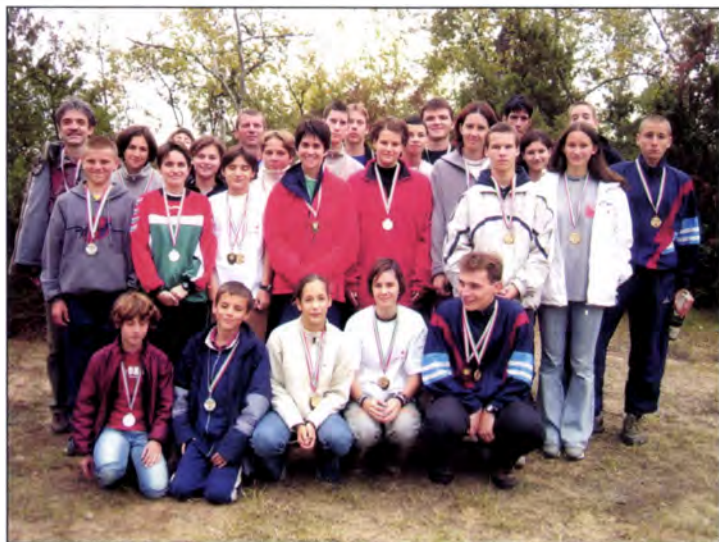
A 2003-as OCSB érem termése.