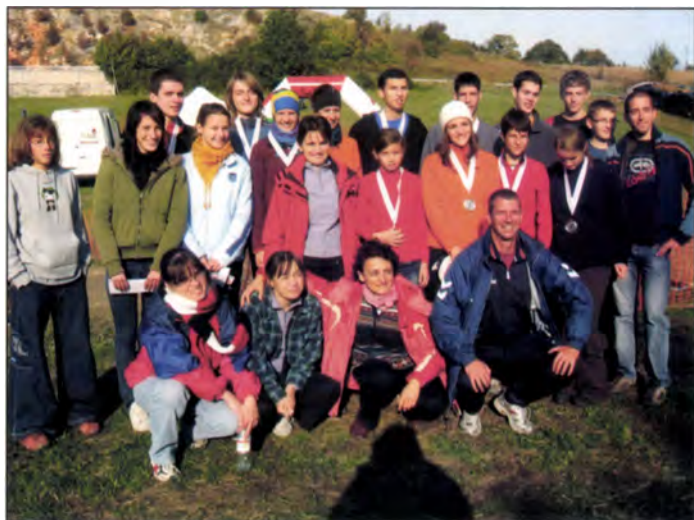
SZVSE csoportkép (Egyesületi Váltó OB, 2008)