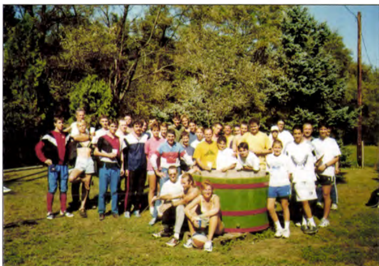
SZVSE csoportkép (Zsana, Pásztor tanya, 1999)