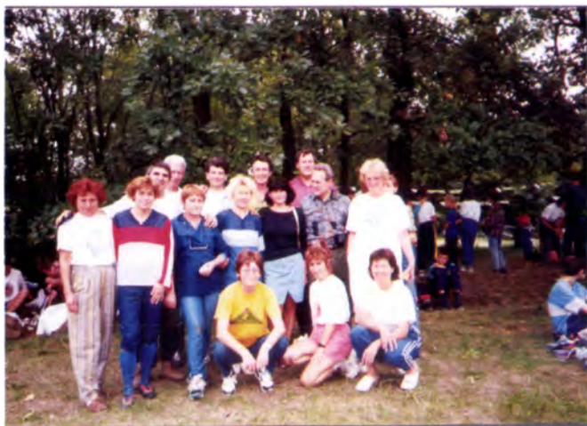
Csongrád megyei bajnokság, nosztalgia verseny (Zsana, 1998)