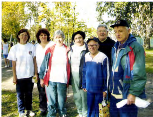
A Hódmezővásárhely Kupa rendezőinek gyűrűjében (Gyopárosfürdő, 2005)