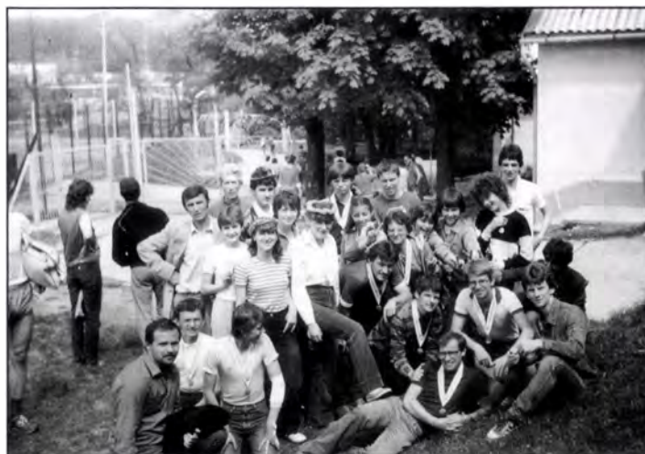
SZVSE tájékoztatósi futói Mecsek Kupa (1982)