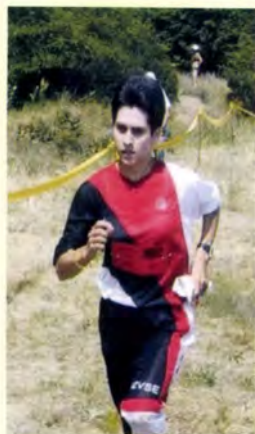
OLÁH KATALIN 1995. VB kétszeres egyéni világbajnok