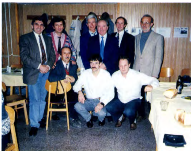
SZVSE Szenior Válogatott Kerete (1995)