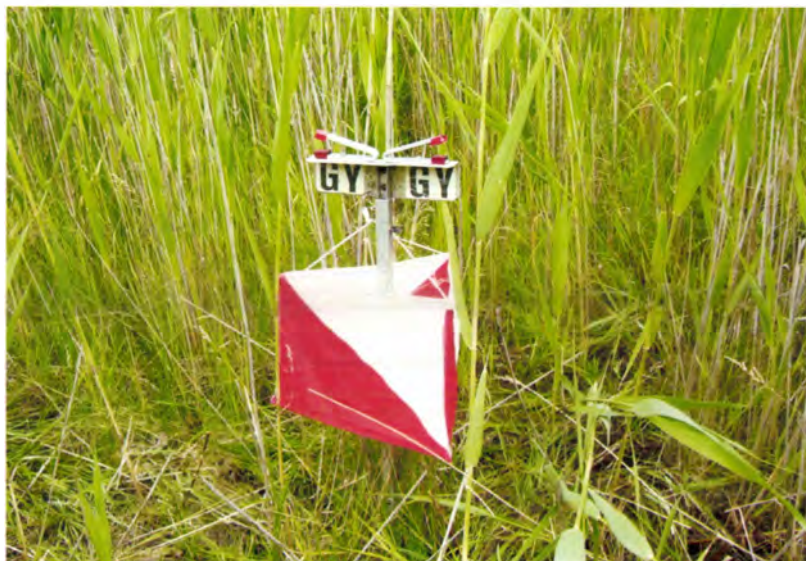
Az első 50 év „befutópontja”, ami egyben, a következő 50 év „kiindulópontja” is