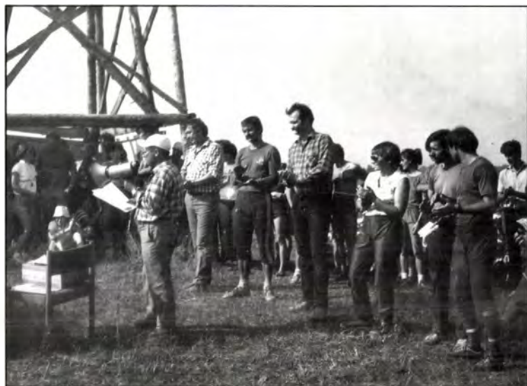
Országos Nappali Egyéni Bajnokság eredményhirdetése (Jánoshalma, 1985)