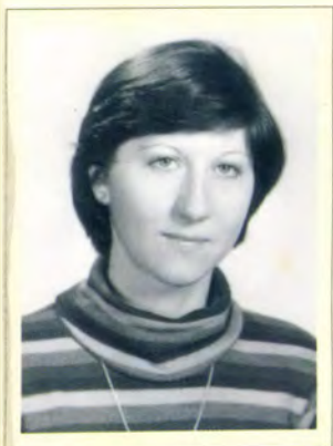
ROSTÁS IRÉN 1976. VB váltó bronzérmes